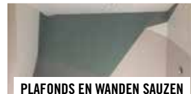
PLAFONDS EN WANDEN SAUZEN