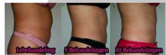
Na 10 behandelingen een verlies van alleen al 5,5cm buikomvang!

Het bindweefsel is de plek waar vocht en vetcellen zich ophopen. Door de speciaal hierop gerichte massagetechnieken worden de opgehoopte afvalstoffen uit het lichaam gevoerd. De werking wordt versterkt door de speciale pakking welke op de gekozen zone wordt gedaan. De massage wordt afgesloten door nog een aantal banen met cupping cups. Het is een stevige intensieve massage. Voor het verliezen van centimeters wordt deze massage in kuurvorm aangeboden. Dit bevat een intake, metingen, 10xmassage, pakking en een eindconsult. De massage kan in 5 weken, 7 weken of 10 weken worden afgerond. Zie voor meer informatie de website of social mediakanalen.